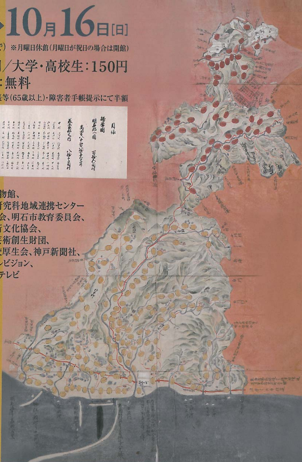
明石藩領絵図【個人蔵】