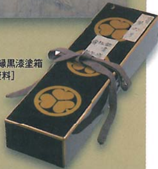
葵紋付金縁黒漆塗箱 【黒田家資料】