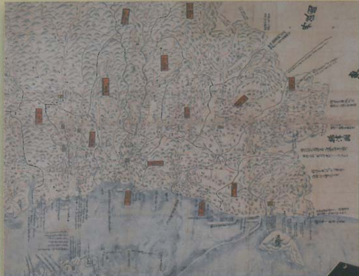
播磨国絵図【当館蔵】

「絵図にみる明石藩領のすがた」「黒田家伝来の工芸品一金工」を各コーナーのテーマとした展示を行います。