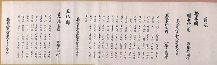
領目録写【松平家文書】

主催/明石市、明石市立文化博物館、 神戸大学大学院人文学研究科地域連携センター 後援/兵庫県、兵庫県教育委員会、明石市教育委員会、 公益財団法人兵庫県芸術文化協会、 公益財団法人明石文化芸術創生財団、 一般財団法人兵庫県学校厚生会、神戸新聞社、 NHK神戸放送局、サンテレビジョン、 ラジオ関西、明石ケーブルテレビ