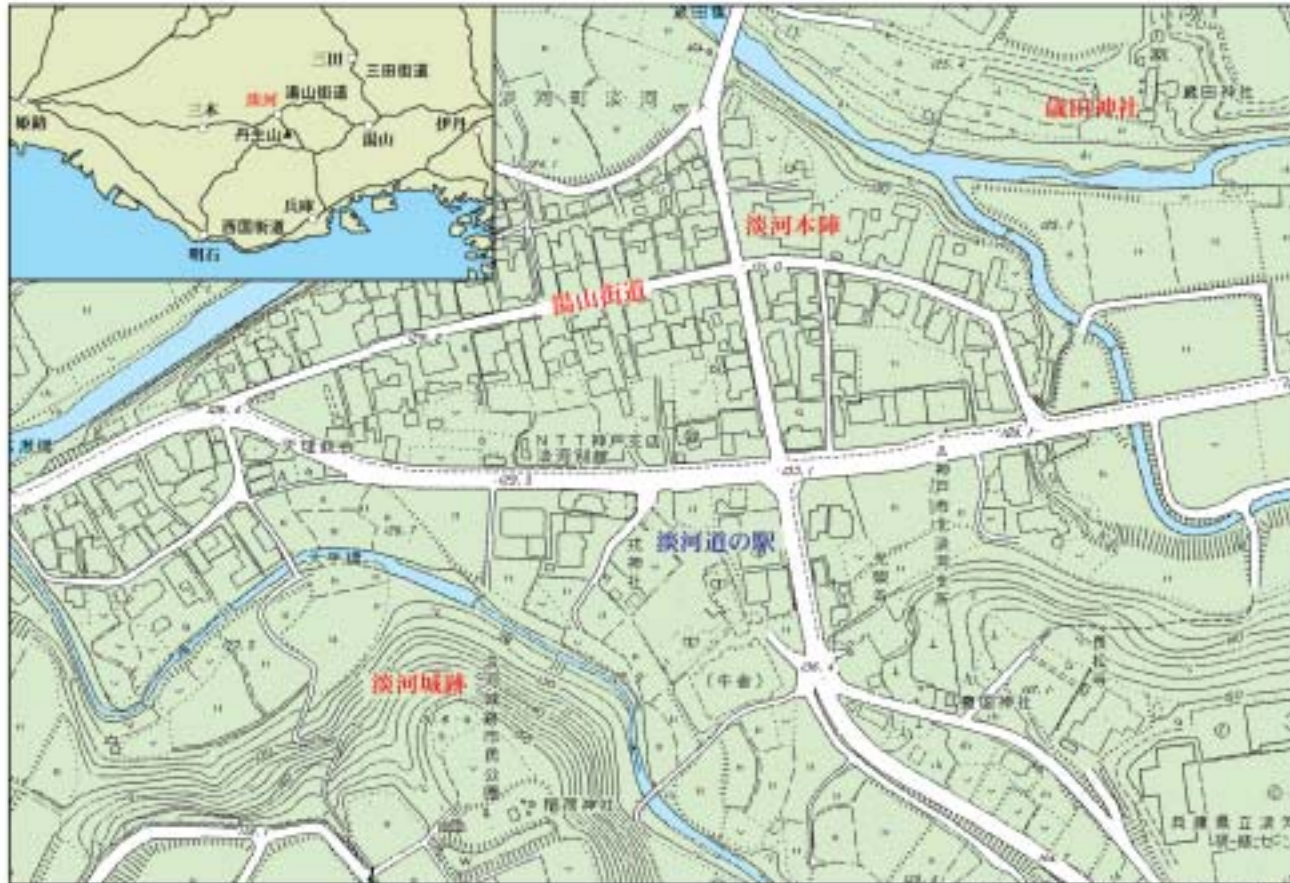
神戸市教育委員会提供の地図に加筆