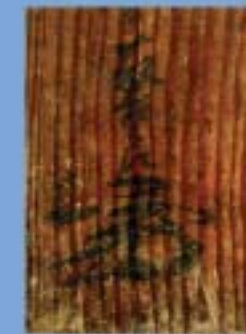
署判部分の拡大 「藤吉郎」